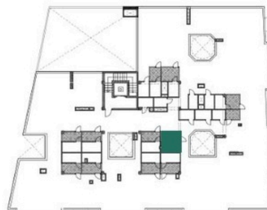
ubicación trastero y lavadero