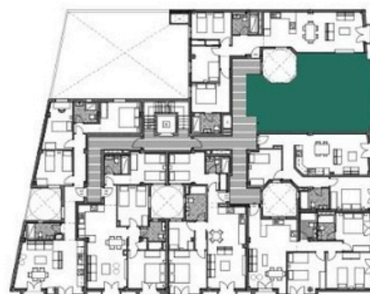
ubicaci3n vivienda en planta